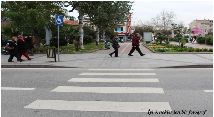
İyi örneklerden bir fotoğraf

Not: Bu yazı ‘Engelsiz Kent’ raporundan alınmıştır. Tam metin yayınlanacaktır.