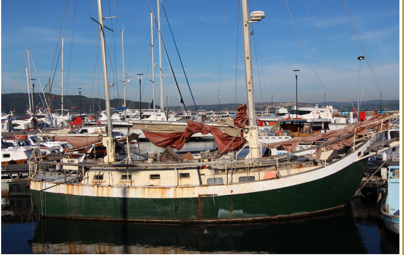
Marinada paslanmaya bırakılmış yat(!)