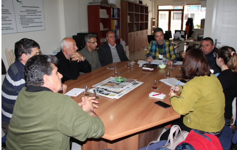
Çalışma Grubu toplantısından