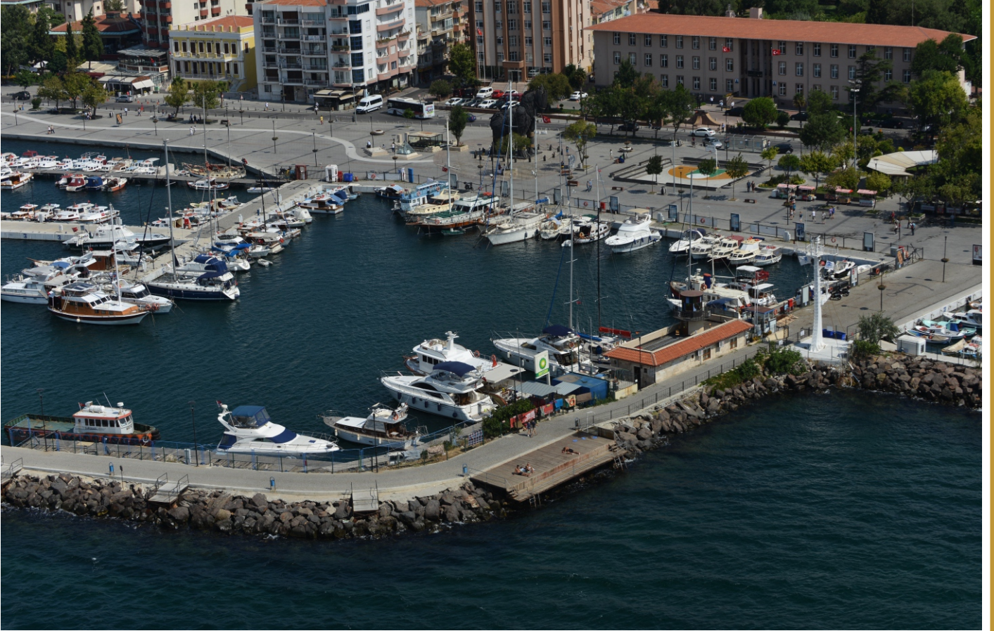
Çanakkale Yat Limanı