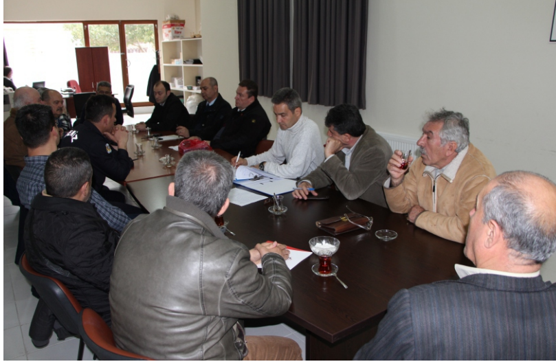
Çalışma Grubu toplantısından