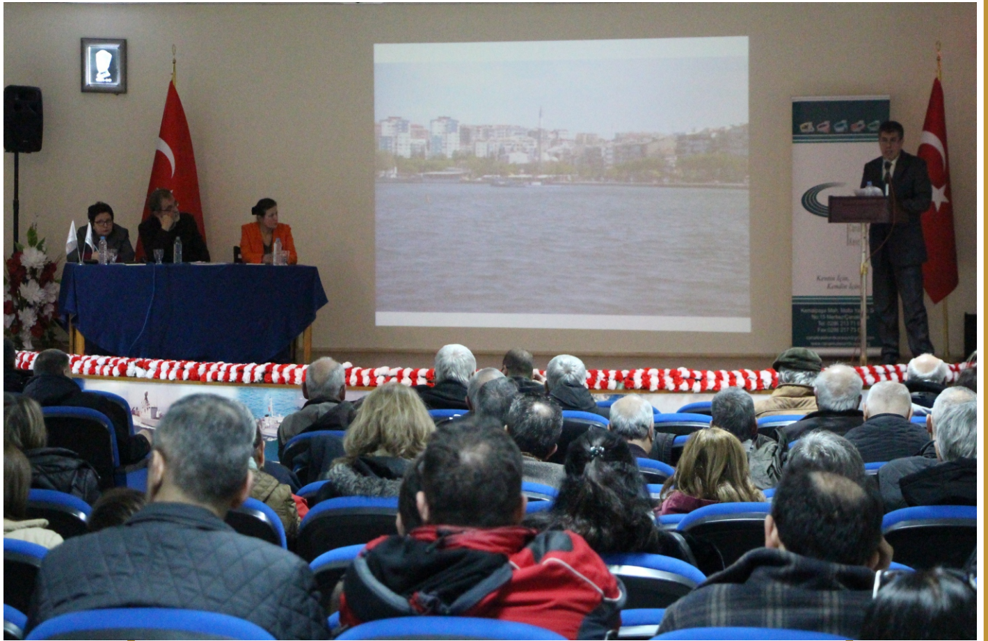
Kent Konseyi Genel Kurulunda Rapor Sunuluyor.