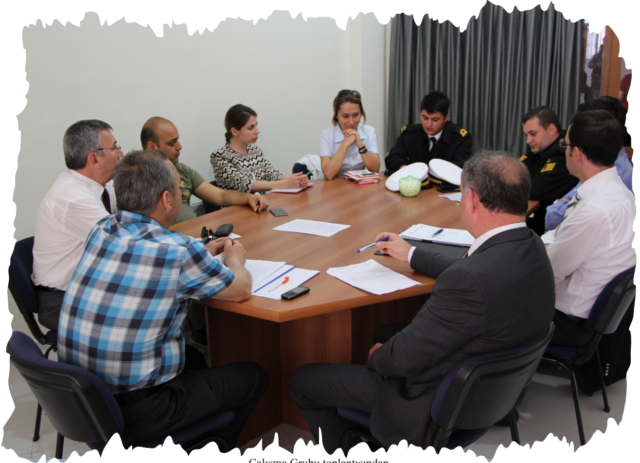
Çalışma Grubu toplantısından