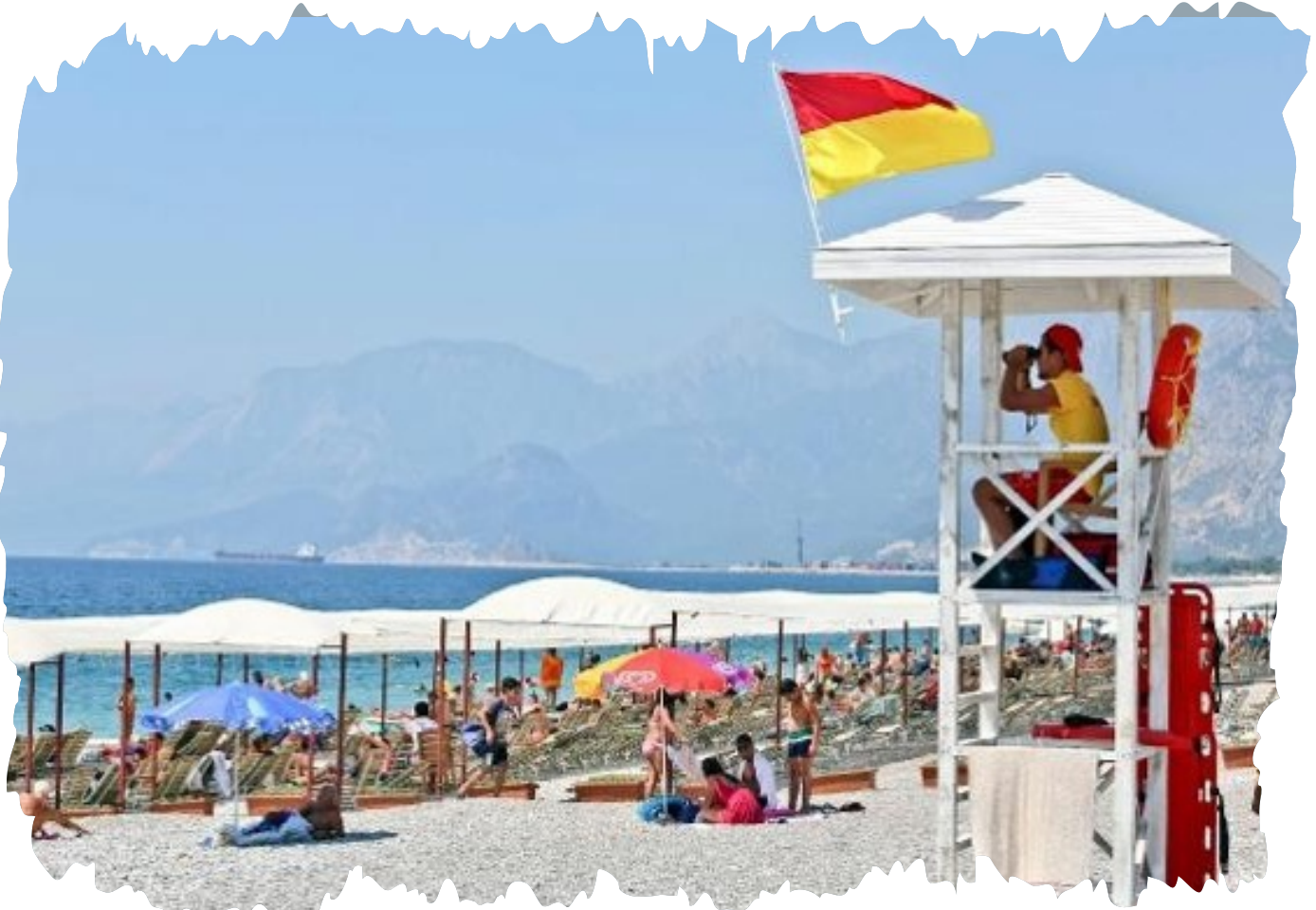
Plajda görev başında Cankurtaran