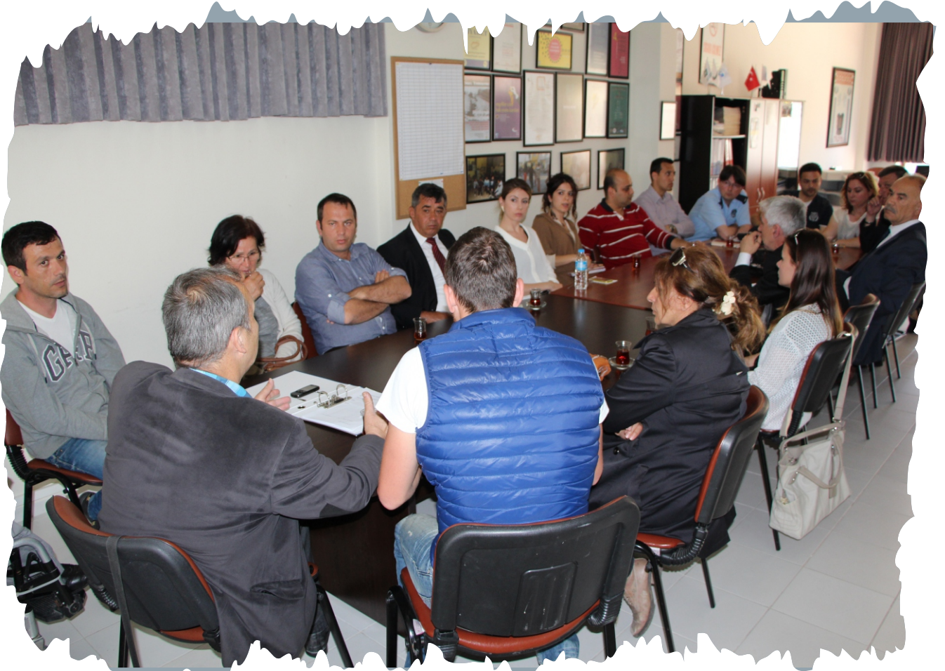
Çalışma Grubu toplantısından